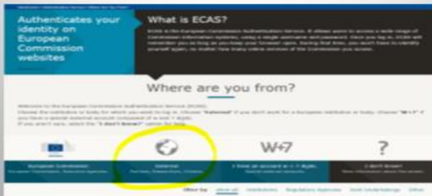
Si vedrà, quindi la schemata qui sotto